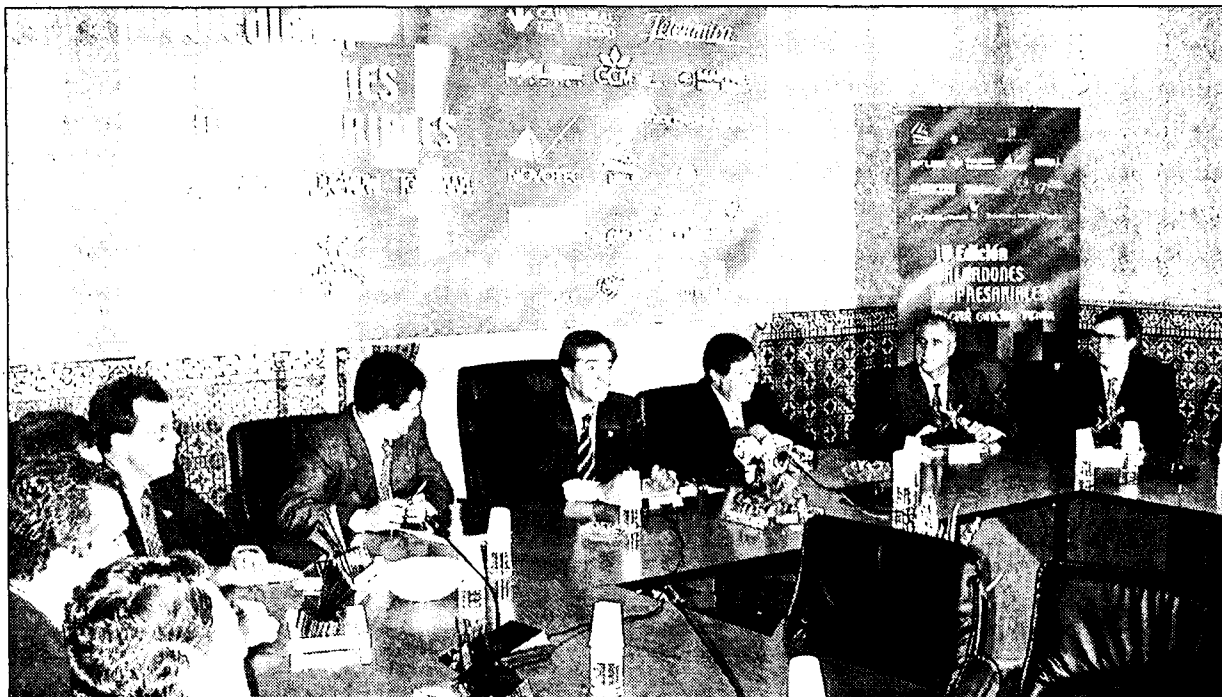
FEDETO DIO A CONOCER EL LISTADO DE GALARDONES EMPRESARIALES 2000.