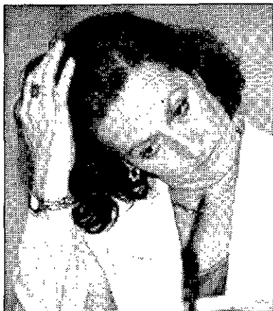
JUSTICIA Mariscal de Gante.

Pese a estas críticas, la ministra reiteró que "este asunto es el de el indulto solicitado individualmente por dos personas, y serán los requisitos individuales de condena impuesta y condiciones personales las que deberán ser tenidas en cuenta a la hora de pronunciarse sobre la concesión o denegación de un indulto".