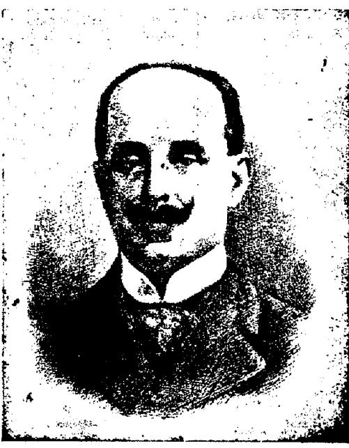
Don Francisco García Santos, ilustre fundador de la Unión Postal de las Américas y España, que puede ser clasificado entre las grandes figuras del Correo universal.

Con referencia al Congreso, único celebrado en España, aparte del Universal de 1920, del año 31, diremos que se celebró en el Palacio del Senado del 10 de octubre al 19 de noviembre siendo clausurado por Su Majestad los Reyes de España. Durante su celebración se revisaron todas las cláusulas de los Congresos anteriores, dándose el caso de ser el primer Congreso en el que las actas fueron firmadas por todos