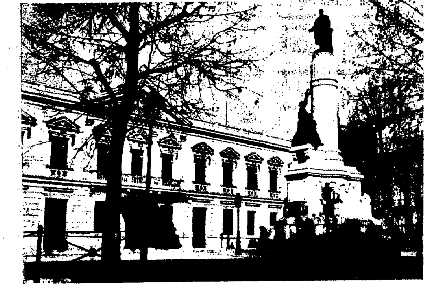
En este edificio antaño que otrora fué Palacio del Senado se llevaron a cabo los actos y las tareas del III Congreso Postal de las Américas y España:

Tuvieron origen estos Congresos con el fin de extender y perfeccionar sus relaciones postales los países iberoamericanos y de establecer una solidaridad de acciones los Congresos Universales, capaz de representar eficazmente sus intereses comunes en los que se refiere a las comunicaciones por correo, en el I Congreso de la Unión Panamericana celebrado en Buenos Aires en septiembre de 1921. España se adhirió a este Congreso