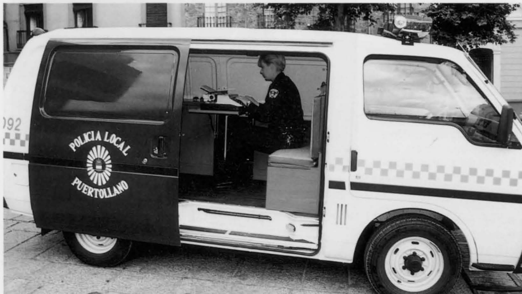
Se ha incorporado al servicio una furgoneta de atestados para facilitar los trámites administrativos

Desde el pasado 26 de abril funciona en Puertollano la Policía de barrio. Con este innovador proyecto, por el que se asigna cierto número de agentes municipales a cada uno de los cinco distritos en que se ha dividido la Ciudad, se descentraliza el servicio policial y se reforzará tanto la seguridad ciudadana como el cumplimiento de las ordenanzas municipales.