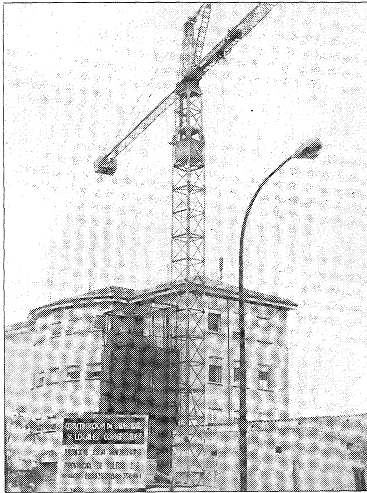
La falta de suelo urbanizable impide que la demanda de viviendas sea satisfecha.

Para los empresarios, sería conveniente que se agilizaran las gestiones para poder acceder a la construcción, con el fin de que los