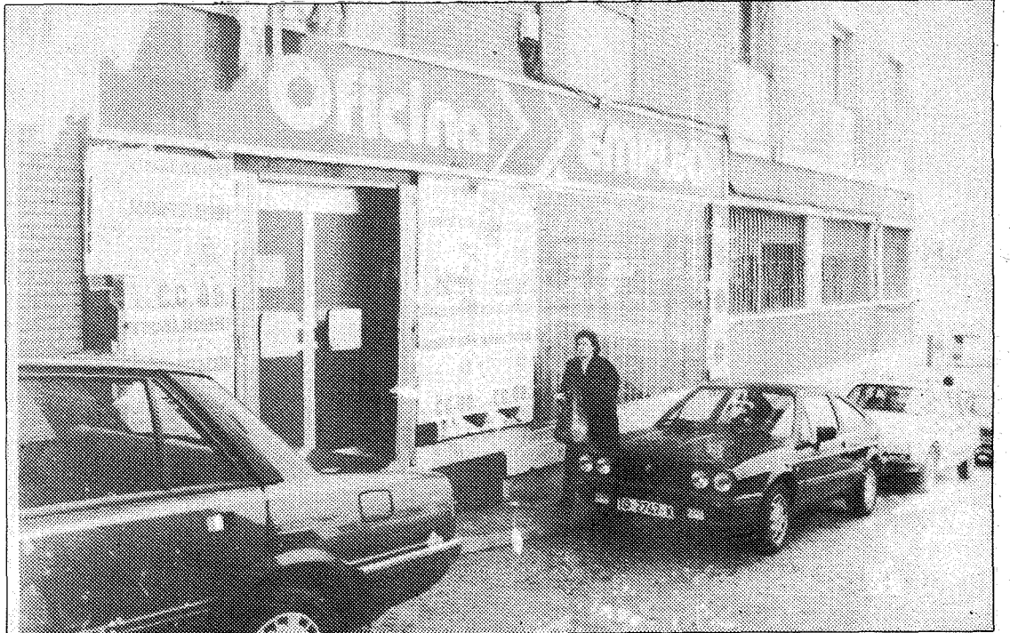
El número de varones parados es 16.524. El de mujeres, 11.646.