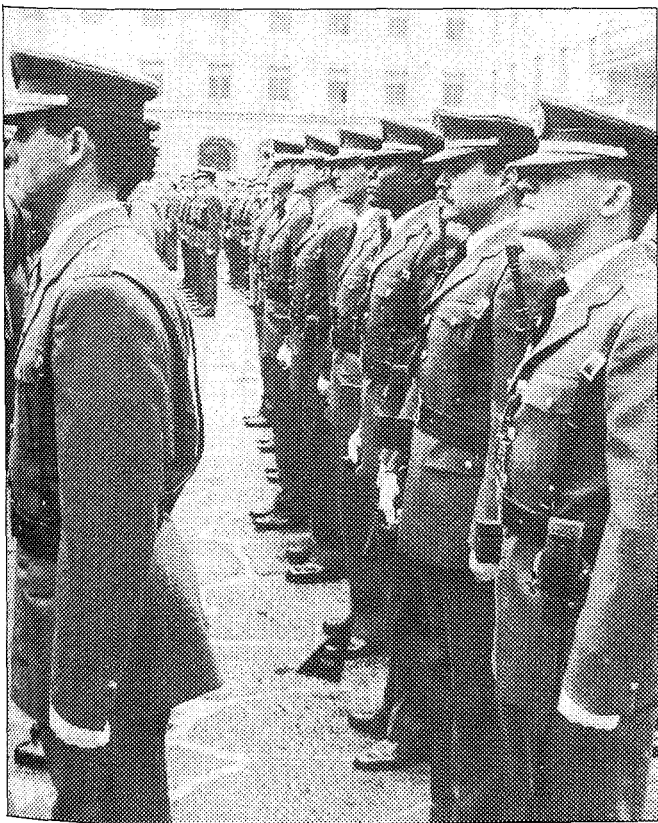
Verdadero espíritu militar demostraron poseer los caballeros cadetes que en la mañana de ayer permanecieron firmes bajo la intensa lluvia, durante todo el tiempo que duró el acto que la Academia Militar de Toledo organizó con motivo de la llegada del Rey Juan Carlos I a Toledo.

Aunque está por encima de la media nacional