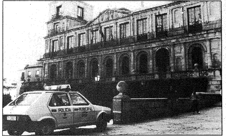
El Ayuntamiento de Toledo a Hacienda en estos momentos 163 millones de pesetas.

se ha salvado un problema de tesorería, pero de alguna manera el tema está ahí. He llevado yo las gestiones, pues se ha tratado de un tema urgente, he estado en contacto permanente con el Delegado de Hacienda».