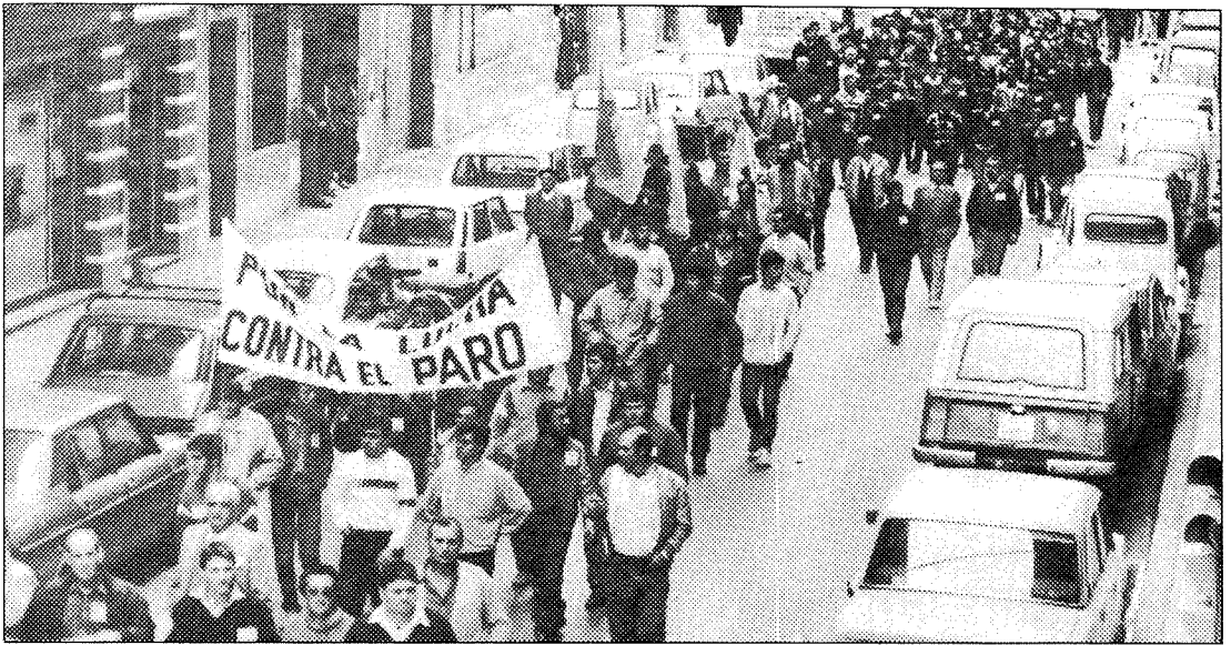
Hasta el mes de octubre en las oficinas de empleo toledanas habían cerca de treinta mil personas inscritas.

taje significa que un total de 964 personas se inscribieron en las ocho oficinas de empleo que existen en Toledo. El paro tan sólo disminuyó en el sector industrial, mientras que en el resto creció, sobre todo en el área de servicios y agricultura.