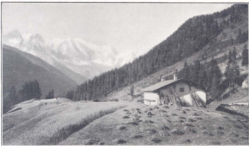
Hecha con filtro de luz «Kodak».