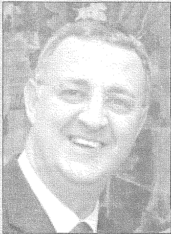
Jesús Caldera, ministro de Trabajo y Asuntos Sociales