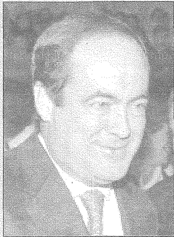
José Bono, ministro de Defensa de España