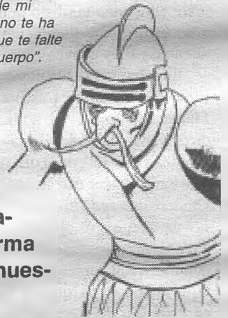
RAFAEL TOLEDO DÍAZ

"Así será, y yo estoy muy contento de que te quieras valer de mi ánimo, el cual no te ha de faltar, aunque te falte el ánimo del cuerpo".