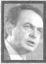
José Luis Rodríguez Zapatero

Zapatero consiguió en la encuesta el 59,40 % de los votos y su oponente el 40,50 %.