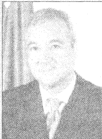
Ramón Luis Valcarcel, presidente de la Región de Murcia