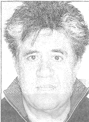
Pedro Almodóvar, cineasta castellano-manchego