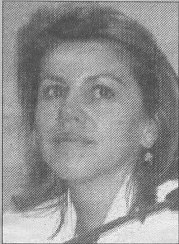
María Dolores Cospedal, presidenta regional del PP