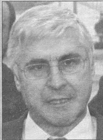
José María Barreda, presidente de Castilla-La Mancha