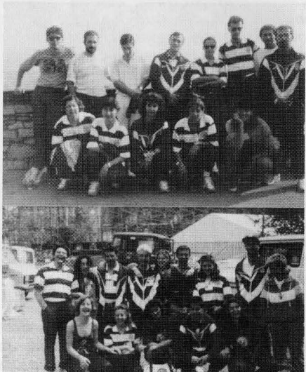
Componentes de los dos equipos que viajaron a Italia para participar en el programa "Juegos sin fronteras"

Un grupo de 22 almagreños ha representado a España en el programa televisivo "Juegos sin fronteras" que se rodó en Bérgamo (Italia) a finales del pasado mes de mayo, y que será emitido por TVE en los meses de julio y agosto.