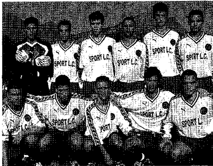
Este es el Conquense Juvenil que derrotó al Leganés en su última comparecencia en "Las Quinientas". Hoy intentará repetir.