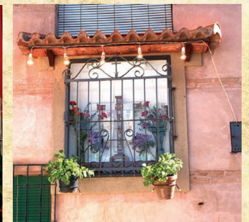
Cruz de Rosillo - Vecinos