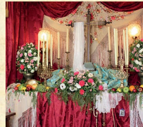
Cruz c/ Nietos - Vecinos