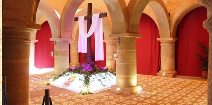
Cruz del Pueblo - Asoc. Cultural los Danzantes