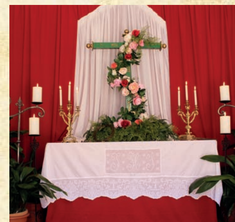
Cruz Verde - Vecinos