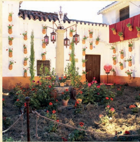
Cruz de la Tercia - Vecinos - Premio "Mejor Puñao"