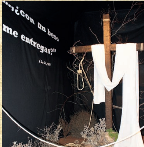
Cruz c/ Santo Tomás - Centro la Pietá - Premio Especial