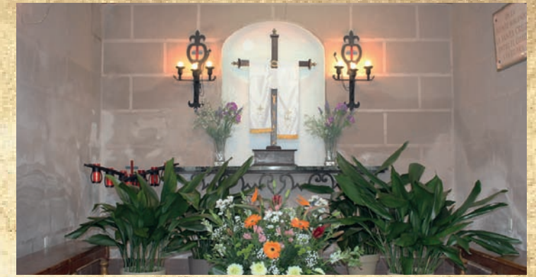
Cruz Ermita Puente Malenas - Vecinos