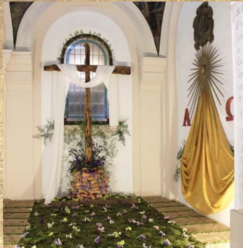
Iglesia de la Trinidad- Mayordomos - 1er Premio