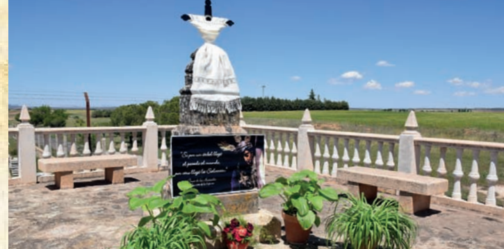
Cruz de los Asetados - Hnos. Gallego Tercero