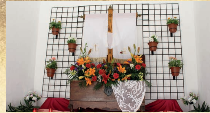
Cruz Ermita c/ Cruces y Vicario - Vecinos