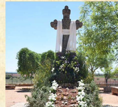
Cruz del Siglo - Vecinos