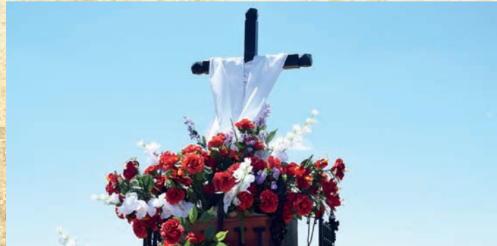
Cruz de la Moraleja