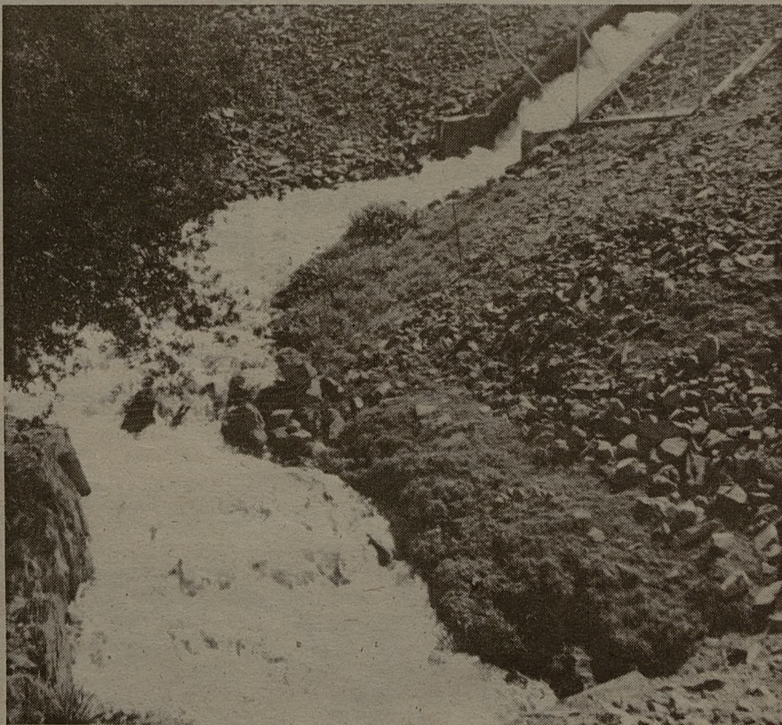
El trasvase de agua desde el Jándula al Montoro ha supuesto un coste de 4.000 millones de pesetas.

hectómetros los que han caído. Además lo han hecho de mala manera, pues en una de las presas pequeñas el agua que cayó fue producto de una tormenta y lo que hizo fue