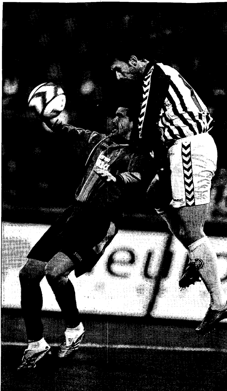
El rumano contra lucha por el control del cuero con Prica.

OCASIONES PARA MARCAR. Del Moral dispuso de dos ocasiones seguidas a la vuelta de los vestuarios. Sobre todo la segunda, individual, que deshizo Zaza. Pero más clara aún fue la que tuvo Braulio,