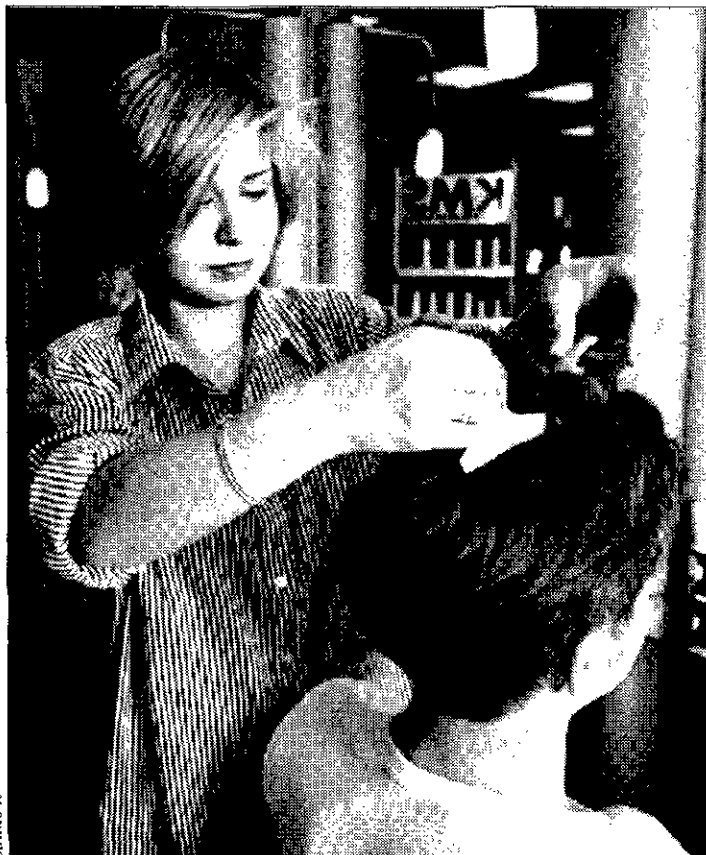
PELUQUERA Era de las consideradas profesiones tradicionales para la mujer.