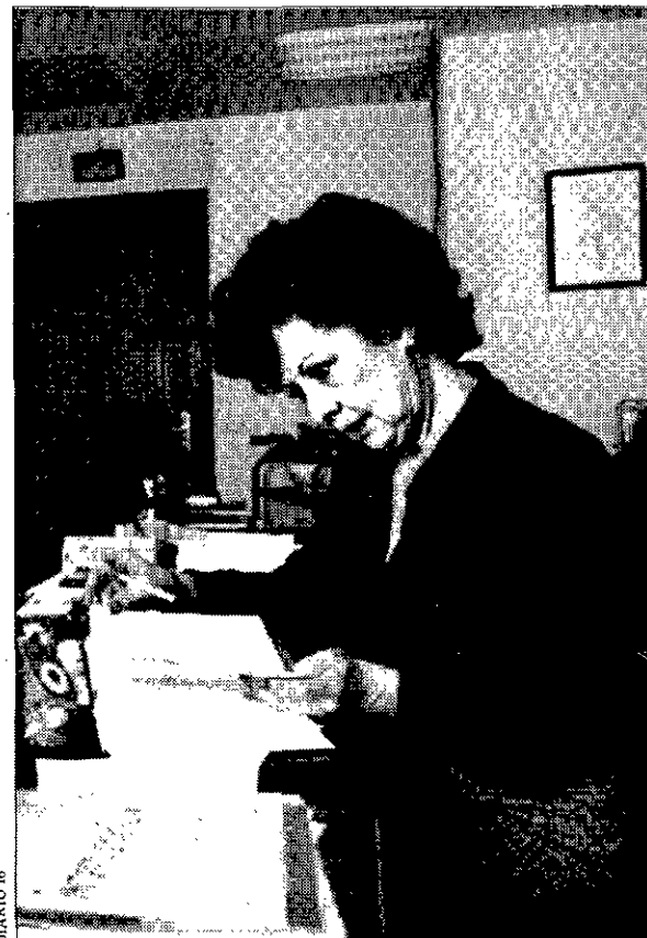
SECRETARIA Su trabajo es considerado de gran importancia.

Con su sentencia, el Tribunal Europeo contenta a quienes le tildaron de machista