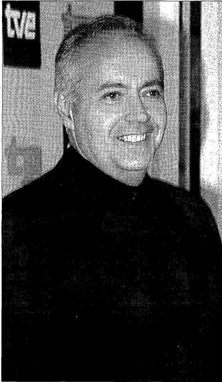
El popular 'showman' recibió el impacto de una barra de hierro.

El concejal advirtió de que las cámaras de seguridad instaladas en los accesos de la M-50 a la carretera que une Majadahonda con Boadilla, en cuyos márgenes se encuentra la urbanización Monte de las Encinas donde reside el empre-