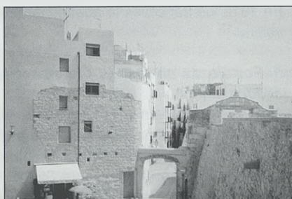
Muralla de Peñíscola

medieval que había sido abaluartado, en época moderna, para facilitar su defensa frente a los ataques piratas y en otros conflictos, como la Guerra de Sucesión, al ser una plaza emplazada en la costa de indudable interés.