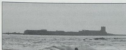
Castillo de Sancti-Petri

En cuanto al castillo de Sancti Petri , formaba parte de las defensas