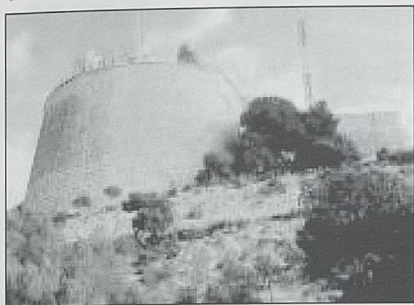
Castillo de San Fernando

defensa el castillo de San Fernando que se encuentra en la ciudad, en la zona del monte Tossal y el cerro de San Francisco, no muy lejos del Castillo de Santa Bárbara.