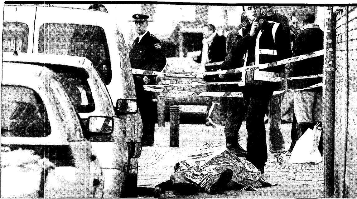
Abatido en plena calle. Un ciudadano de unos 45 años y origen colombiano murió en la mañana de ayer en Madrid, en concreto en una calle del distrito de Carabanchel, tras ser tiroteado a las 11,15 horas. La víctima, que falleció en el acto, presentó un impacto de bala en la cabeza y tres en el tórax.