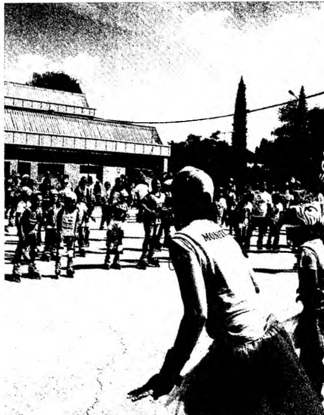
Una monitora dirige una de las actividades.

que el patinaje pueda conllevar mucho riesgo, "cualquier otro deporte también tiene sus riesgos. Con el patinaje, lo importante es ir aprendiendo con la progresión adecuada y bajo la tutela de un buen monitor que sepa guiarte y marcarte los ejercicios adecuados".