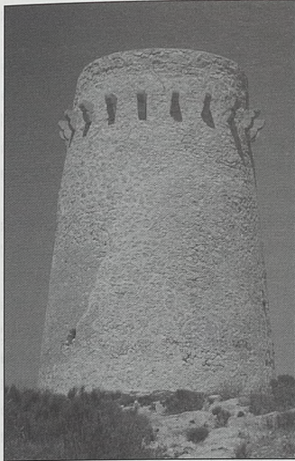
Torre de Moraira. Teulada