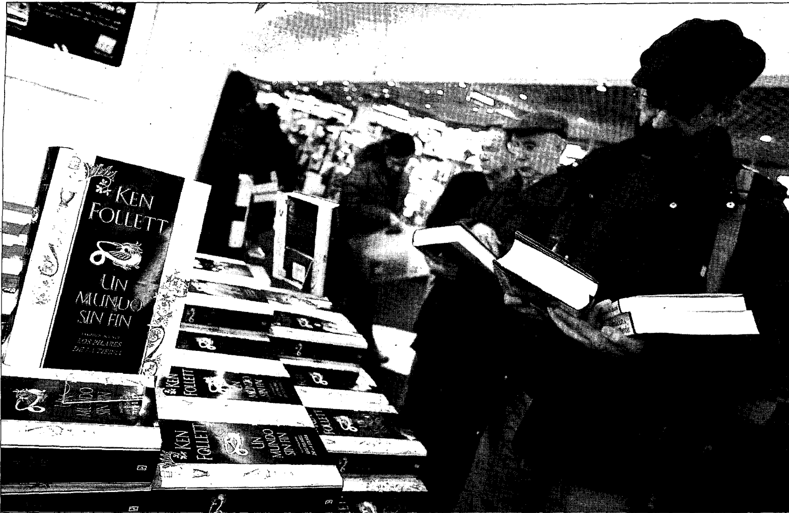
Un potencial lector de 'Un mundo sin fin' ojea un ejemplar del libro, entre otras novedades.