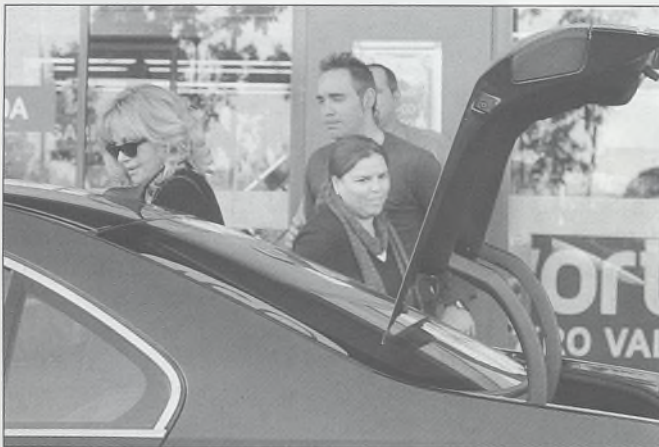
Melanie y una asistente, con la que hablaba en inglés, fueron recogidas por un vehículo privado a las puertas de un conocido centro comercial toledano.

C orrió la voz por un conocido centro comercial de Toledo de que por allí andaba la mismísima Melanie Griffith . Se detectaba su presencia en el segundo piso, en compañía de otra señora, con la que hablaba en inglés. Y es que una mujer rubia, alta y con porte juvenil no pasa fácilmente desapercibida.