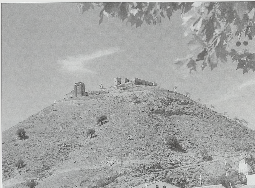
Monte y fortaleza vistos desde la estación ferroviaria

después de ese primer intento— y durante el gran «empujón» reconquistador dado por los Reyes Católicos, Alora volvió a ser atacada; esta vez «con gran empleo de máquinas de asedio y gran ensayo general de artillería de pólvora», terminando por caer en manos de los cristianos; para no volver más a las mahometanas. Por concesión de los Reyes Católicos, Alora fue tenencia de los condes de Palma desde 1501 hasta 1580. Y a partir de esa última fecha toda la fortificación