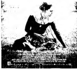
LA SEÑORITA JULIA

La antaño actriz (y una de las preferidas por Ingmar Bergman) y ahora directora, Liv Ullmann, lleva a la pantalla la famosa obra teatral de Strindberg, con Jessica Chastain como protagonista. Es la historia de una joven aristócrata del siglo XIX, un tanto aburrida de las convenciones sociales, que en un momento dado rompe el protocolo y pasa un rato bailando con los criados. El hecho anecdótico va a más con uno de ellos, Jean, secretamente enamorado de ella desde la más tierna infancia.