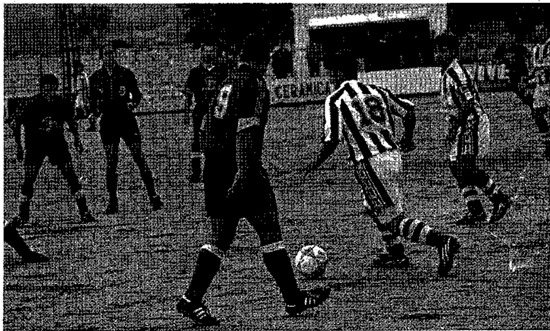
El partido fue luchado, si bien no hubo méritos que hagan justo atribuir la victoria a uno u otro equipo.

En resumidas cuentas, un enfrentamiento en el que un 0-0 hubiera sido lo más justo, porque nadie hizo méritos para ganarlo, y aunque fue luchado, no lo suficiente para sacar puntos.