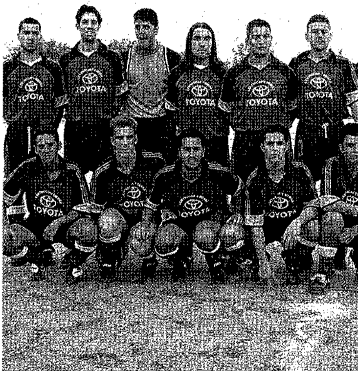
Se fueron estos tres puntos para un equipo en los últimos puestos.