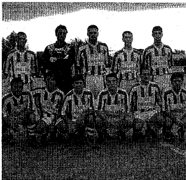
El Escalona suma tres puntos más que buena falta le hacían.