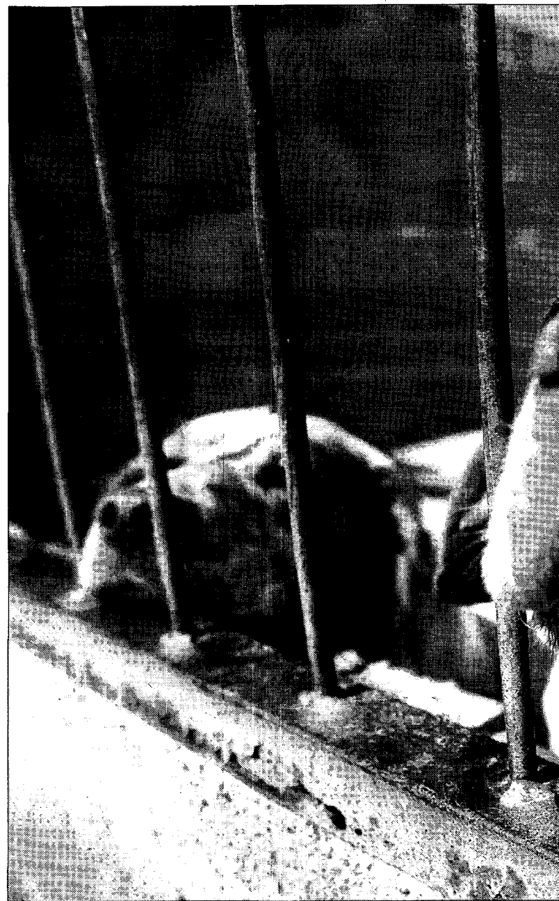
Los maltratadores suelen reaccionar con rabia cuando se les denuncia.

• La vocal de denuncias, una vez que ha recibido una llamada, la pone en conocimiento del Seprona que es el encargado de comprobar el maltrato.