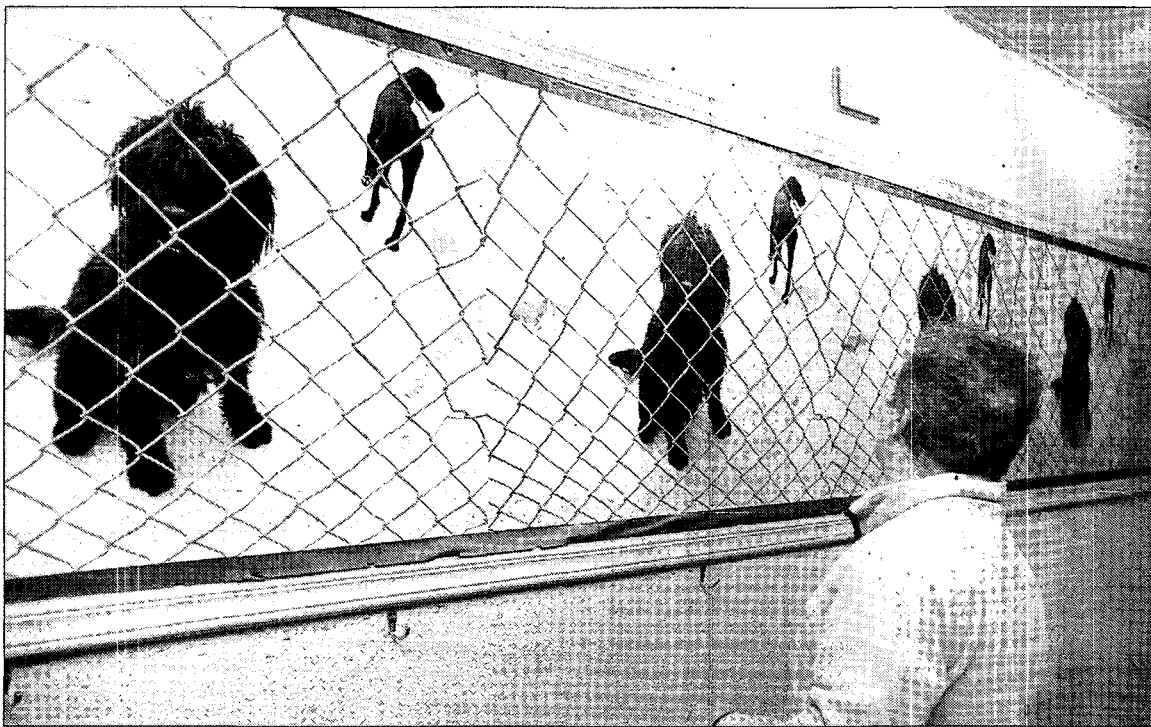
Cuando se da un caso de maltrato muchas protectoras se unen para denunciar y hacer más presión.

La mayoría de las personas que presencian o conocen algún maltrato no se atreven a denunciar, ahora pueden hacerlo