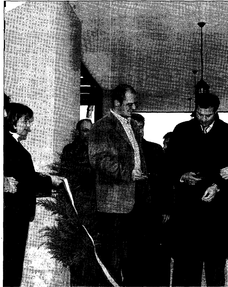
Momento en el que las autoridades cortaban la cinta./DAVID MURGUI