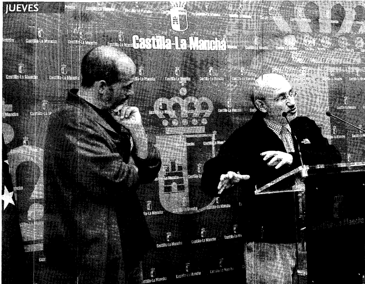
Barreda anunció la creación de un complejo lúdico-científico en Fuentes/TIN BIJAKSIC