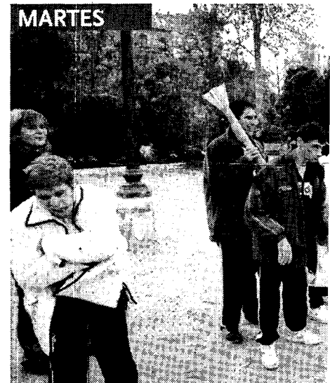
Preparando el día de la discapacidad