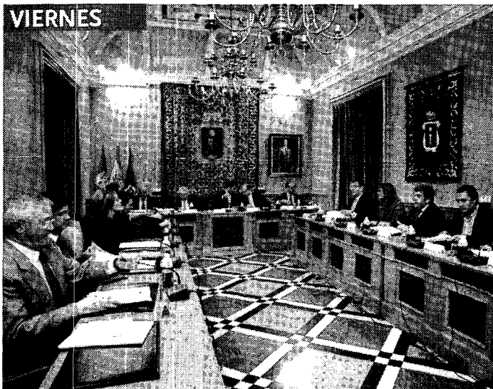
El Consorcio decidió que Cava siguiera como gerente