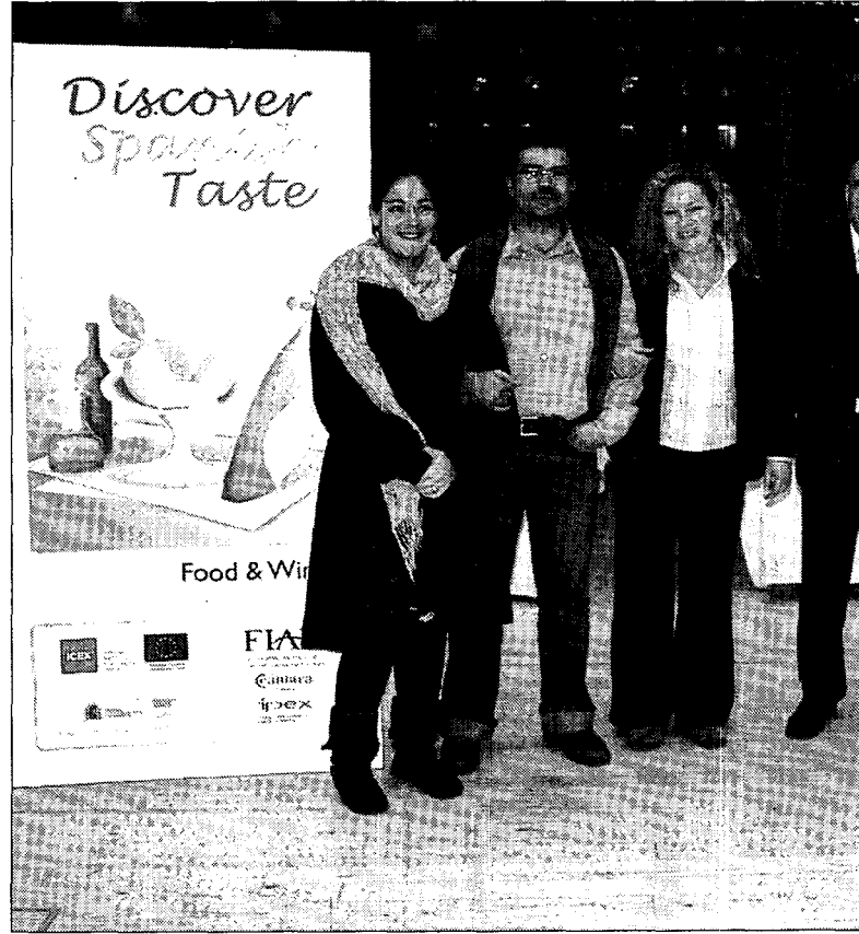
Se presentaron distintos productos en la jornada de Alimentación en Estocolmo. / LT.

Frankfurt, Hannover, Hamburgo, Colonia o Stuttgart.