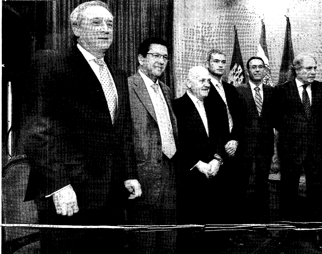
Integrantes del grupo impulsor del nuevo macropolígono de Cuenca.