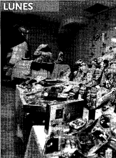
Rastrillo solidario de AECC.