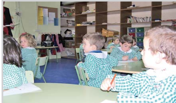
Escuela de Infantil.

El nuevo centro del Barrio Cañicas triplicará su capacidad, ante la expansión y el incremento de población