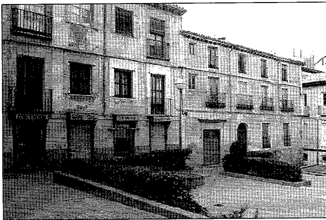
La rehabilitación de fachadas se subvencionará con un 25%.

Según se especifica en la Ordenanza, entre las acciones inmediatas se contempla una subvención de un 3% del presupuesto total de la obra para la rehabilitación del interior de edificios y para las viviendas de nueva construcción y otra del 25% del coste de las obras de rehabilitación de las fachadas de la calle Mayor y su entorno. Los beneficiarios serán los propietarios de edificios comple-