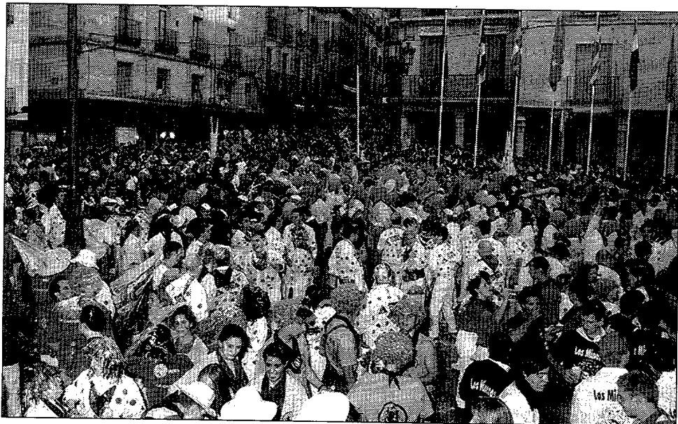
El buen comportamiento de las peñas evitó que se produjeran incidentes.