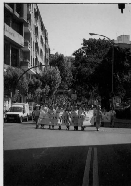
Los trabajadores de Fesa-Enfersa recorren las calles de Puertollano reivindicando la apertura de la factoría.

en su mano, pero prometió a los representantes de los trabajadores que hará lo posible por conseguir la continuidad de la fábrica de Puertollano.