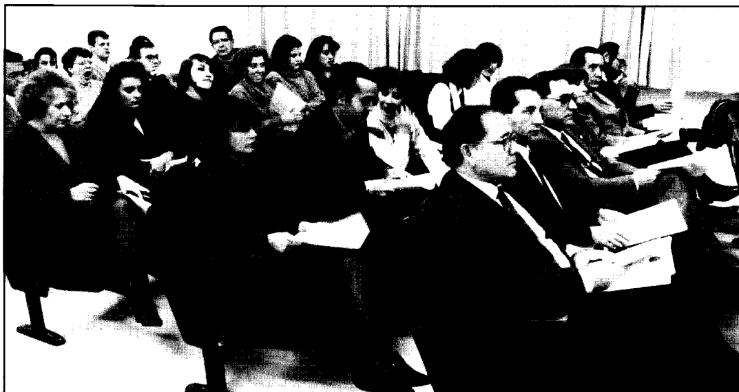
Alumnos que cursan el master, en su primer día de clase