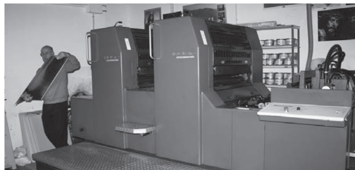
Maquinaria en la fase final de la imprenta