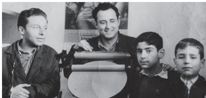
Tercera generación con la titularidad de Imprenta Santo Tomás