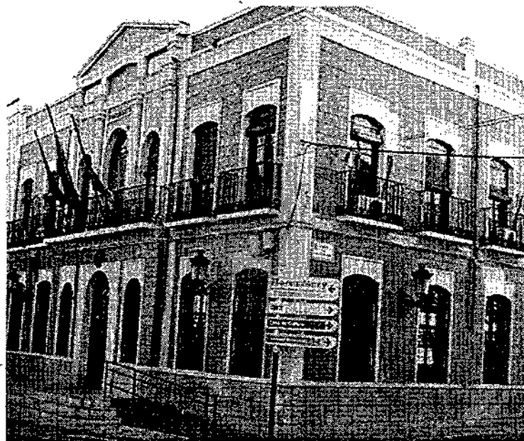
El curso ha sido organizado desde el ayuntamiento quintanareño

Este curso ha sido promovido por la concejalía de la Mujer-centro de la Mujer, del ayuntamiento quintanareño.