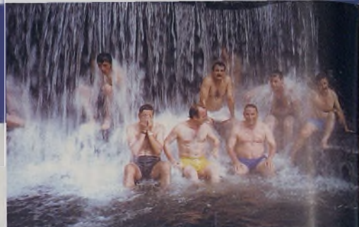
Los veteranos del Alba de gira en Costa Rica

8 Las caras de la noticia. 10 Aquí y ahora.