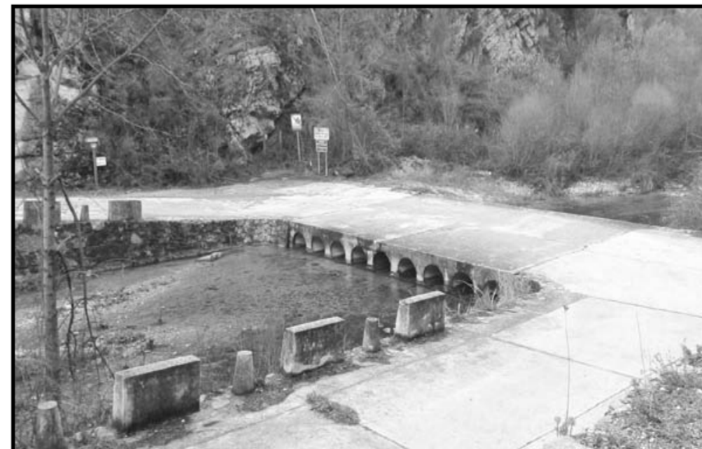
Badén del río Zumeta

Empezaremos por la carretera que accede a Góntar ya sea desde Las Juntas (en mejor estado), o desde Pedro Andrés, que a pesar de tener mejor comunicación con otros pueblos está en una peor situación. No es necesario una opinión propia de los vecinos, sino que a simple vista se aprecia el desgaste del asfalto. La impresión que da es de una carretera dejada u abandonada por los organismos oficiales, quienes sabiendo que es la única vía de acceso a la aldea, no hacen lo suficiente como para que tenga las condiciones adecuadas de tránsito. En cuanto al tema del acceso, hemos de hacer mención al “Puente del río Zumeta”, situado a unos 3.5 km de