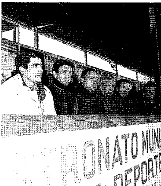
El palco del municipal alcazareño plagado de autoridades. El trio arbitral tuvo una excelente actuación