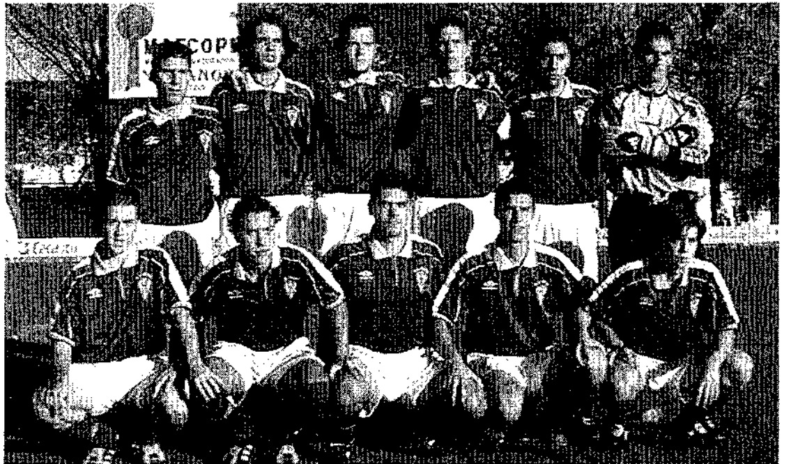
Gimnástico de Alcázar y Toledo demostraron ser dos de los mejores conjuntos de la esta categoría