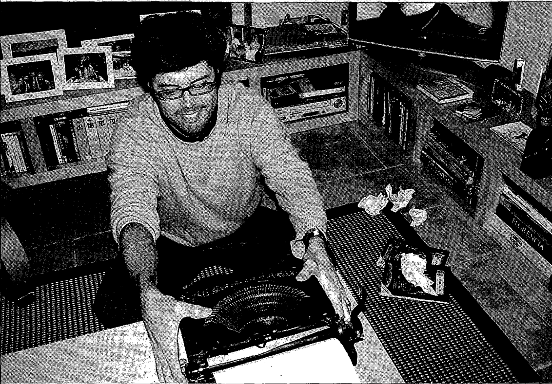
Luis colabora en los libros juveniles basados en la serie 'El internado'; «un buen regalo navideño». / ELENA PÉREZ PALACIOS

Érase una vez un niño bilbaíno que acudía fiel a un videoclub llamado Gabai, donde las estanterías se poblaban de cintas Beta. Un día, su madre se sorprendió de que alquilase por segunda vez Los tres mosqueteros , de Lester... Y tiene 29 años. Como se le ocurrió a un colega suyo en El precio del poder , el mundo es suyo.