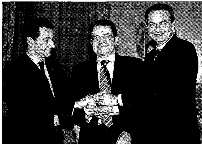
Sarkozy, Prodi y Zapatero, durante la reunión en Roma.

Los tres mandatarios se dieron cita ayer en Roma para relanzar la cooperación política económica con los países del Mediterráneo y cuyo objetivo será impulsar proyectos concretos con la implicación de las instituciones europeas.