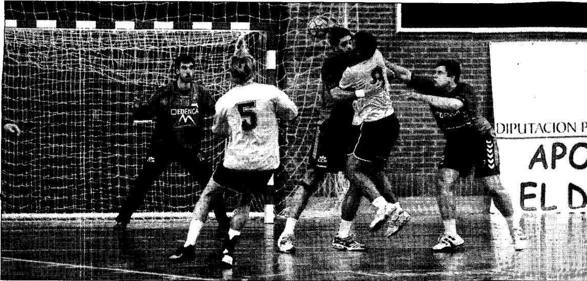
La defensa conquense será clave.