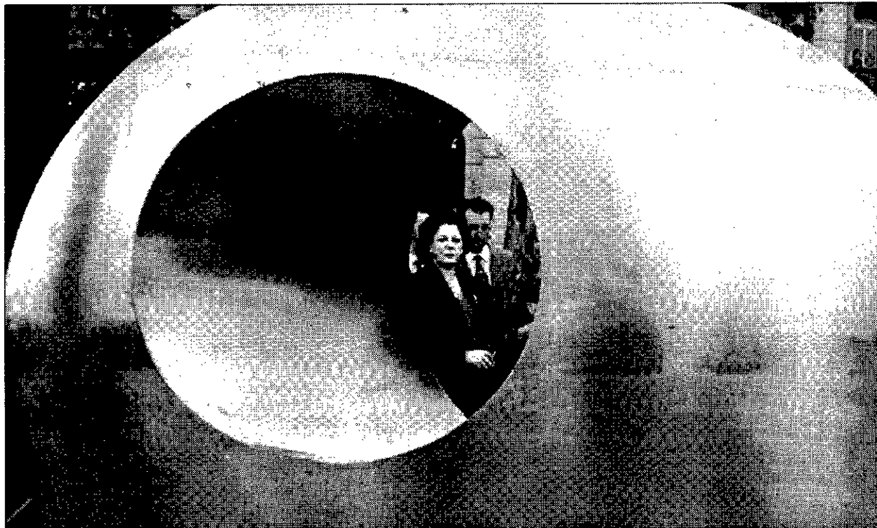
UN MOMENTO DEL PASEO INSTITUCIONAL Rita Barberá, ayer durante el recorrido por una parte de la muestra instalada en la Gran Vía valenciana.

Turia, conviviendo con las altas palmeras y los frondosos árboles circundantes. El paseo puede comenzar a la altura de la calle de Ruzafa, contemplando La flor que camina de Fernand Léger de seis metros de alzada y ejecutada en bronce pintado, para terminar viendo La esfera Lutecia de Jesús Rafael Soto en aluminio pintado,