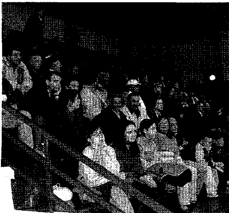
Alrededor de 150 espectadores acudieron a este encuentro.

La jornada para el Balonmano Toledo concluyó el domingo con la victoria del XII Trofeo Diputación de Toledo, en un partido que le enfrentaba a la selección juvenil de Castilla-La Mancha y con un resultado final de 18-23.