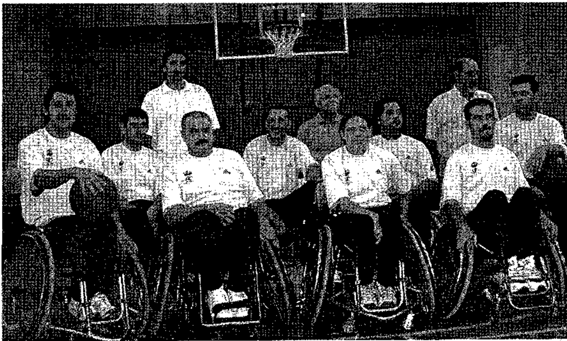
La Peraleda ha visto mejorado sustancialmente su nivel de juego ante el Fundosa Once "B".

La próxima jornada La Peraleda viaja a Almería, donde se medirá al Cludemi.